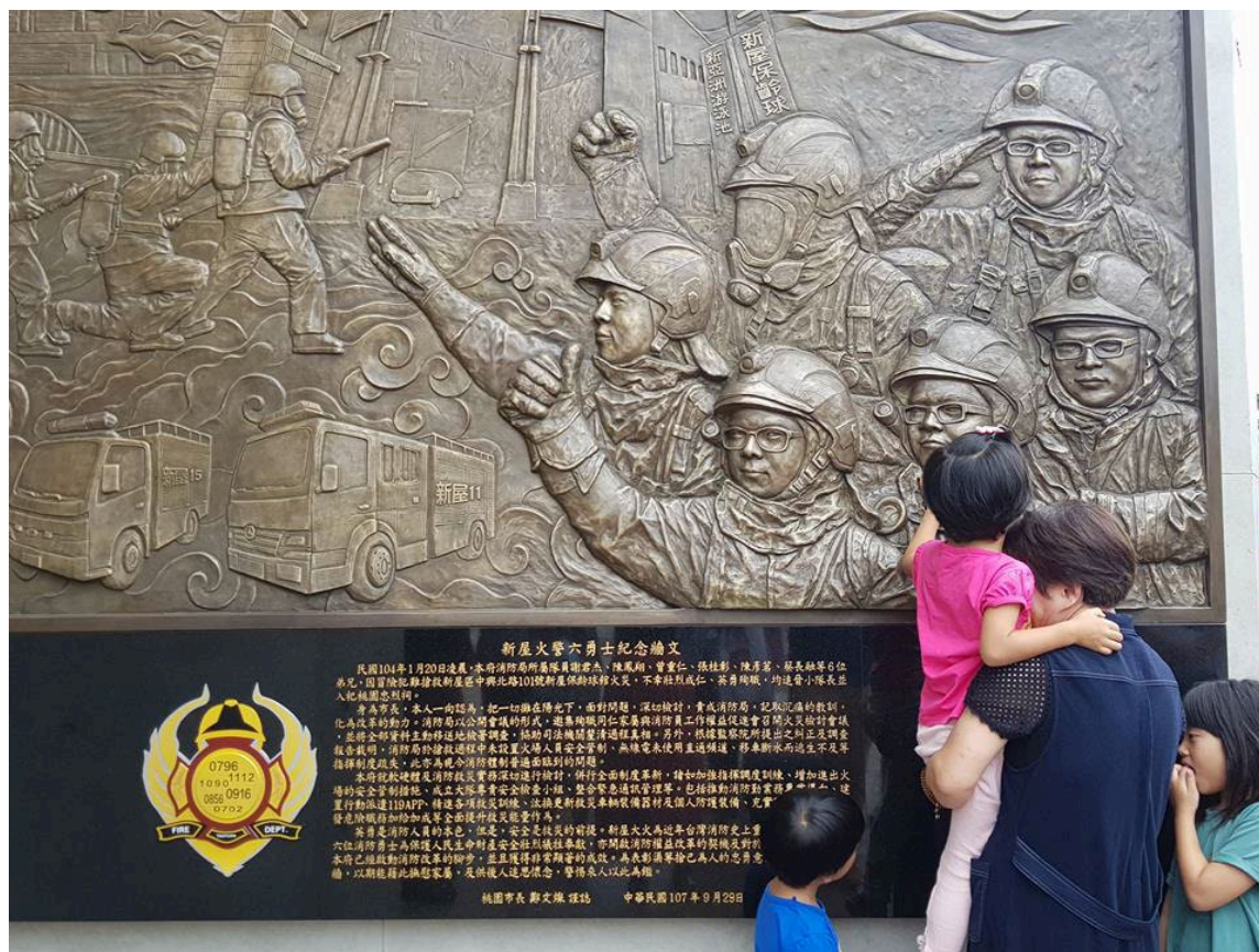
(新屋大火殉職消防員紀念碑)

2015 年 1 月 20 日新屋保齡球館大火，導致 6 名消防員不幸殉職，為我國近年重大集體殉職案，經中華民國消防員工作權益促進協會與殉職家屬共同爭取下，桃園市政府於 2018 年設立殉職消防員紀念碑，碑文及碑體均由協會、家屬、市府共同討論。